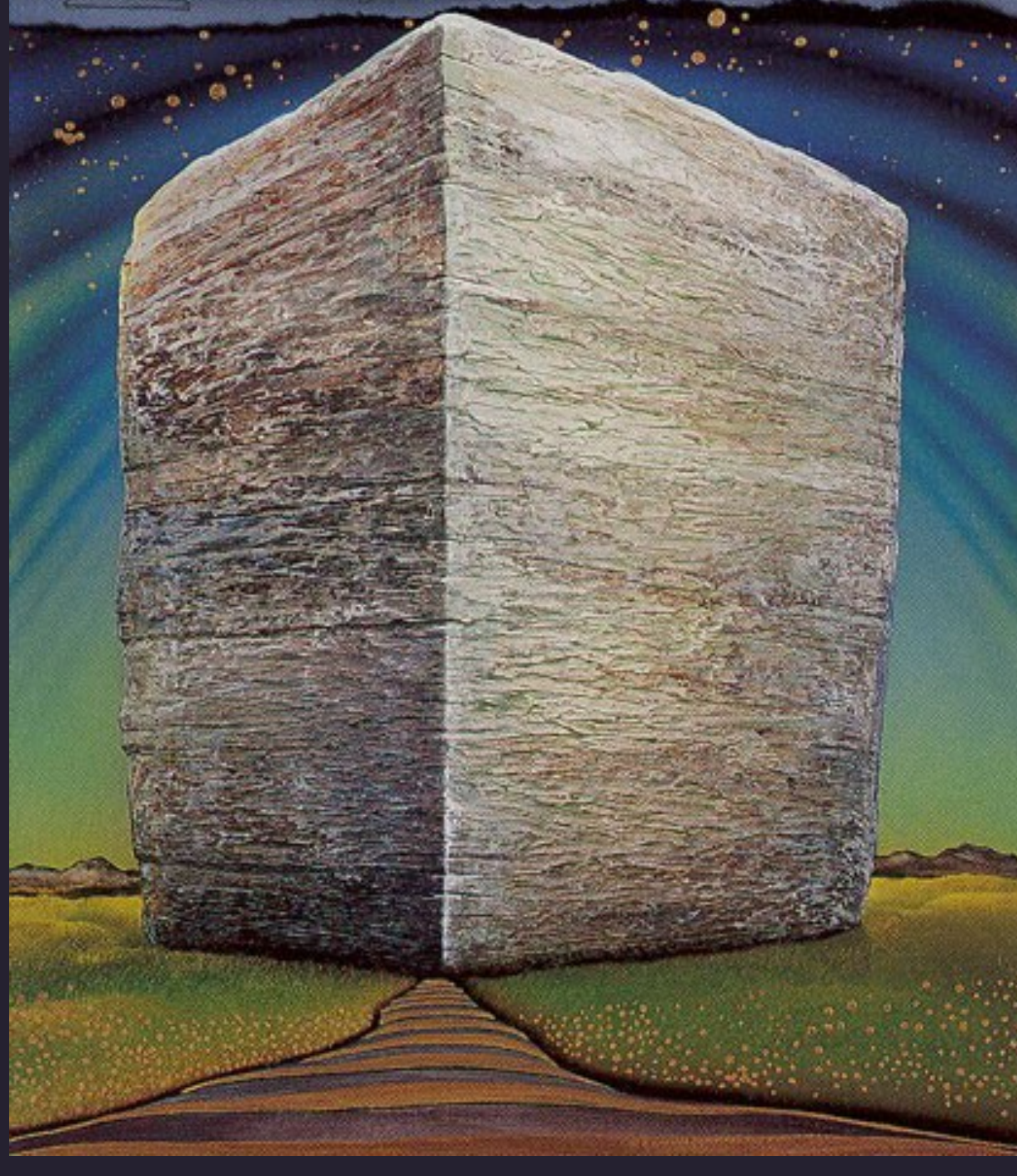
Befreie Dich aus der Unterwelt Hier weiterlesen

Sanft und Muehlos —Aktuelle Artikel von Deepak Chopra u. a.. Redaktion: Dr. Joachim Schneider http://www.wasmachtichlebendig.eu